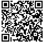
イベントペイ申込ページ

https://eventpay.jp/event_info/?shop_code=5904864638411528&EventCode=2097119837